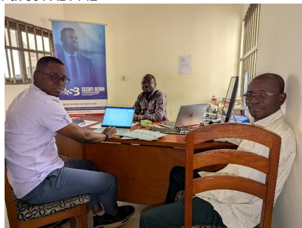
Entretien avec la SAE SECOFI Bénin