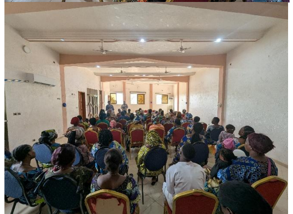
Consultation publique avec les femmes entrepreneures réunies à Abomey-Calavi