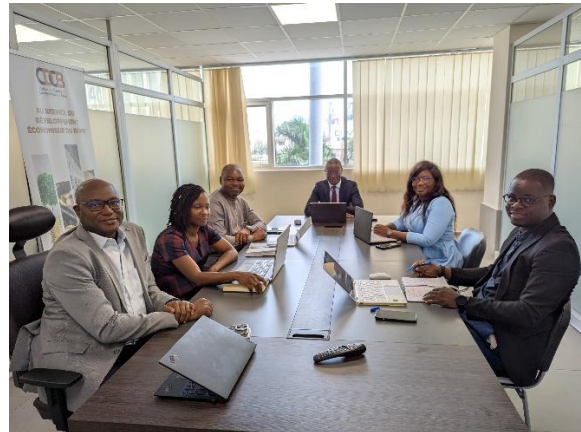
Séance de travail avec la CDC Bénin