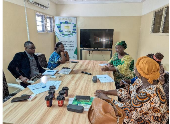
Entretien avec la FEFA Bénin