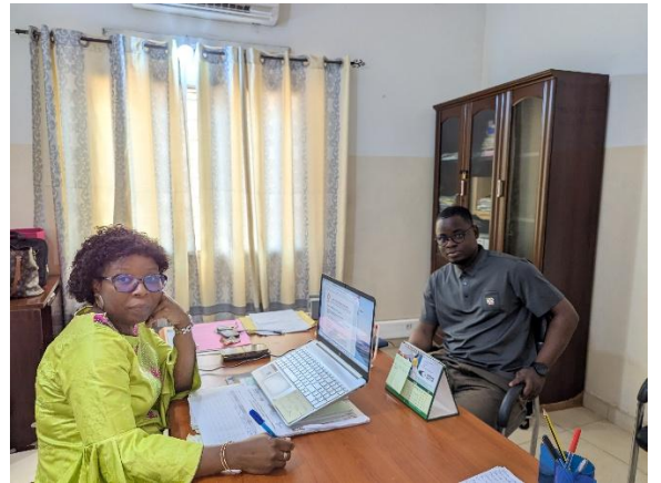
Entretien avec la CA ANPE Atlantique 2