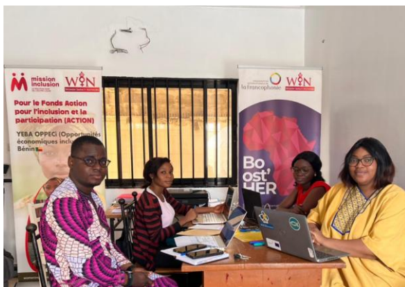
Entretien avec le réseau WIN Bénin