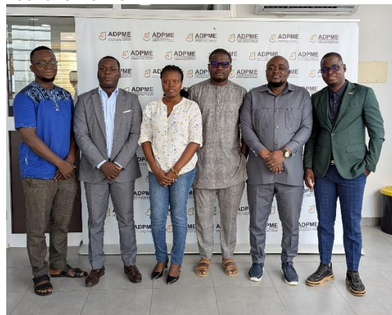
Séance de travail avec l'ADPME